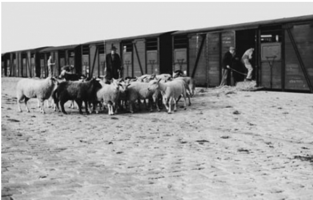
Un débarquement en cours de route aux portes des alpages. Le convoi marquera trois arrêts, à Crest (Vercors), Montdauphin-Guillestre (Queyras) et Briançon.