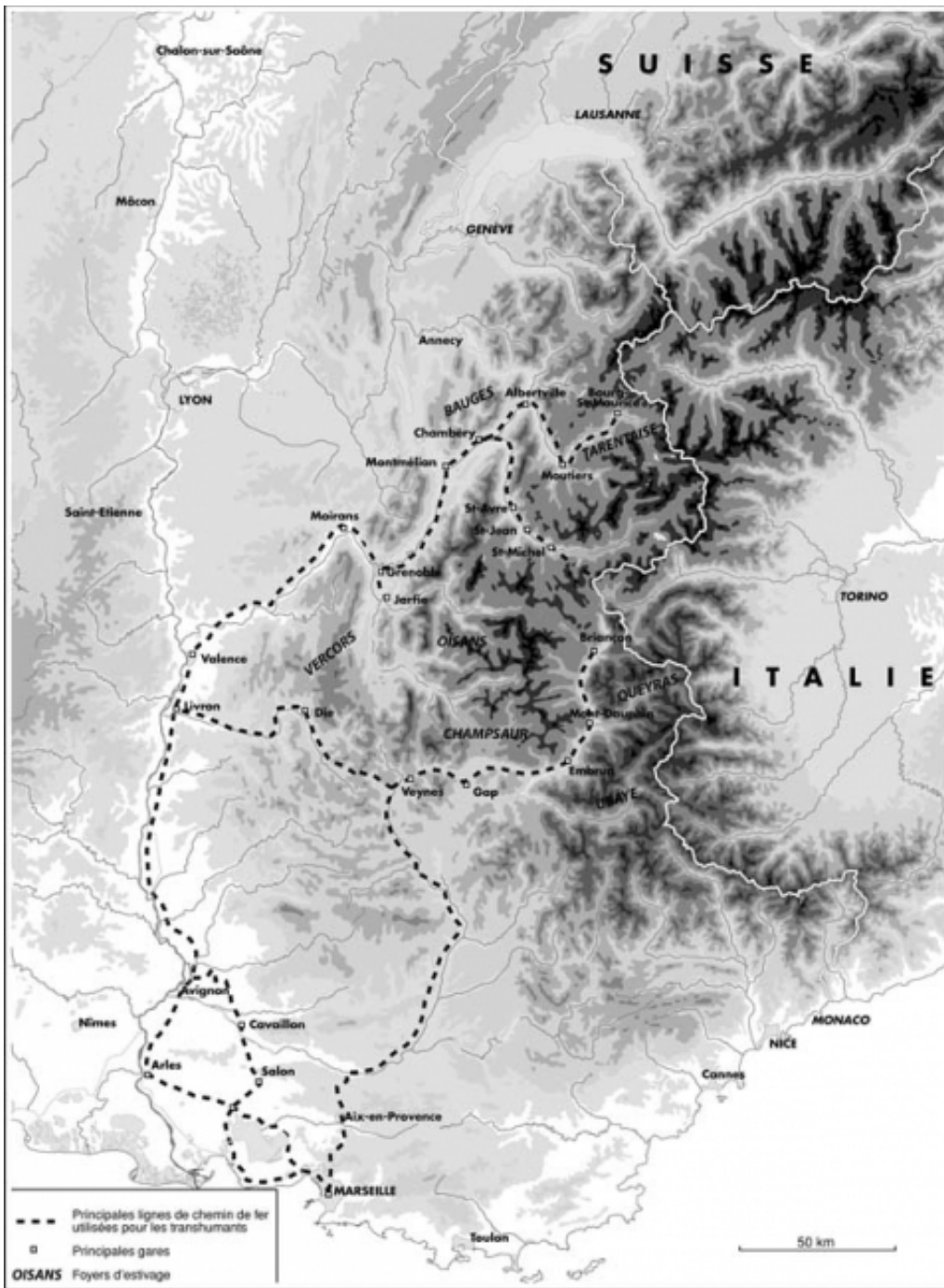
Carte des auteurs.